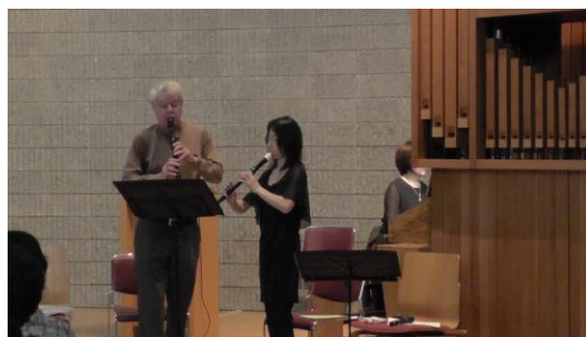
日曜日の午後に関わらず、多くの方がリコーダーの演奏に聴き入っておられました。

「祈りと音楽の集い」も今回で12回目を迎えました。音楽チームとしてはその都度企画に頭を悩ましていますが、外部で活躍されている素晴らしい演奏家の協力も得てここまでやってきました。ただ残念なのは、聴きに來られる方は圧倒的に外部からの人が多く、当教会内の信徒の数が少ないことです。私達は、教会内の皆様と音楽を通じて祈りと分かち合いをしたいと思っています。これからもいろいろな企画を立て継続していく予定ですが、是非、一人でも多くの方のご来場を心よりお待ちしております。 音楽チーム一同