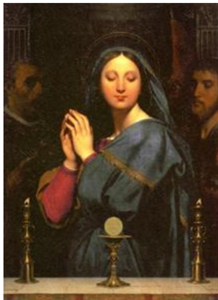
『聖杯の前のマリア』