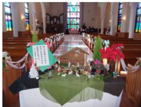
六甲教会からいただいた馬小屋 — 結婚式場のチャペル入口

大震災発生から2年9カ月が経ち、自分の家を再建する人々も増えてきて、あちこちで空き地に家が建ったり、1階の家を壊して3階建てに直したり、多くの努力がなされています。一方、原発から近く、帰宅困難な地域に家があるために仮設住まいを余儀なくされている方々や、「立ち入り禁止」が解除になって帰宅できるようにはなったものの、インフラの整備ができあがらないので戻れないと言う方々もたくさんいらっしゃいます。エピファニーのメンバーにも、浪江出身で、避難生活が続いている方がおられます。また、私たちの住んでいる近くでも、結婚して働いていたお嬢さんが職場で被災して津波に飲まれ、お孫